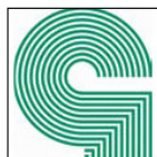
BUNDESINNUNGS- VERBAND DES GLASERHANDWERKS, HADAMAR