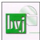
BUNDESVERBAND DER JUNGLASER UND FENSTERBAUER E.V., HADAMAR